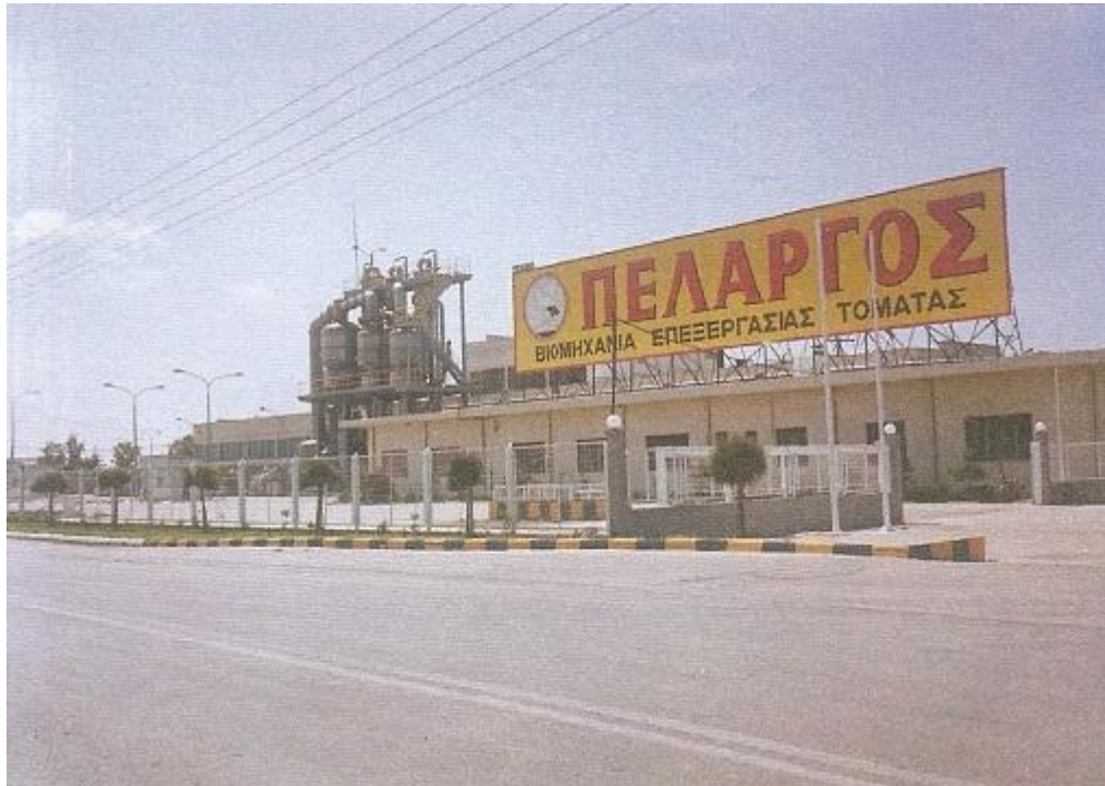
Το εργοστάσιο «Πελαργός» το 1990

σύντομα αναπτύχθηκε και κατάφερε να προωθήσει τον τοματοπολτό και σε αγορές του εξωτερικού. Αρκετές οικογένειες, εκείνη την εποχή, άρχισαν να καλλιεργούν τομάτες ως δεύτερη απασχόληση γιατί το κέρδος ήταν μεγάλο.