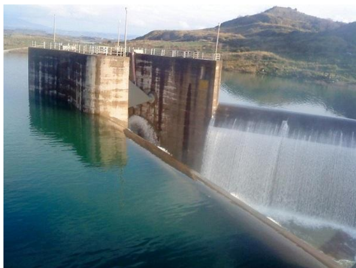
Το φράγμα Πηνειού

Ως προς τους υδάτινους πόρους, οι αγροτικές καλλιέργειες αποτελούν τον κύριο καταναλωτή του νερού. Στην Περιφέρεια Δυτικής Ελλάδας καταγράφονται μια σειρά υφιστάμενων, κατασκευαζόμενων και μελλοντικών αρδευτικών