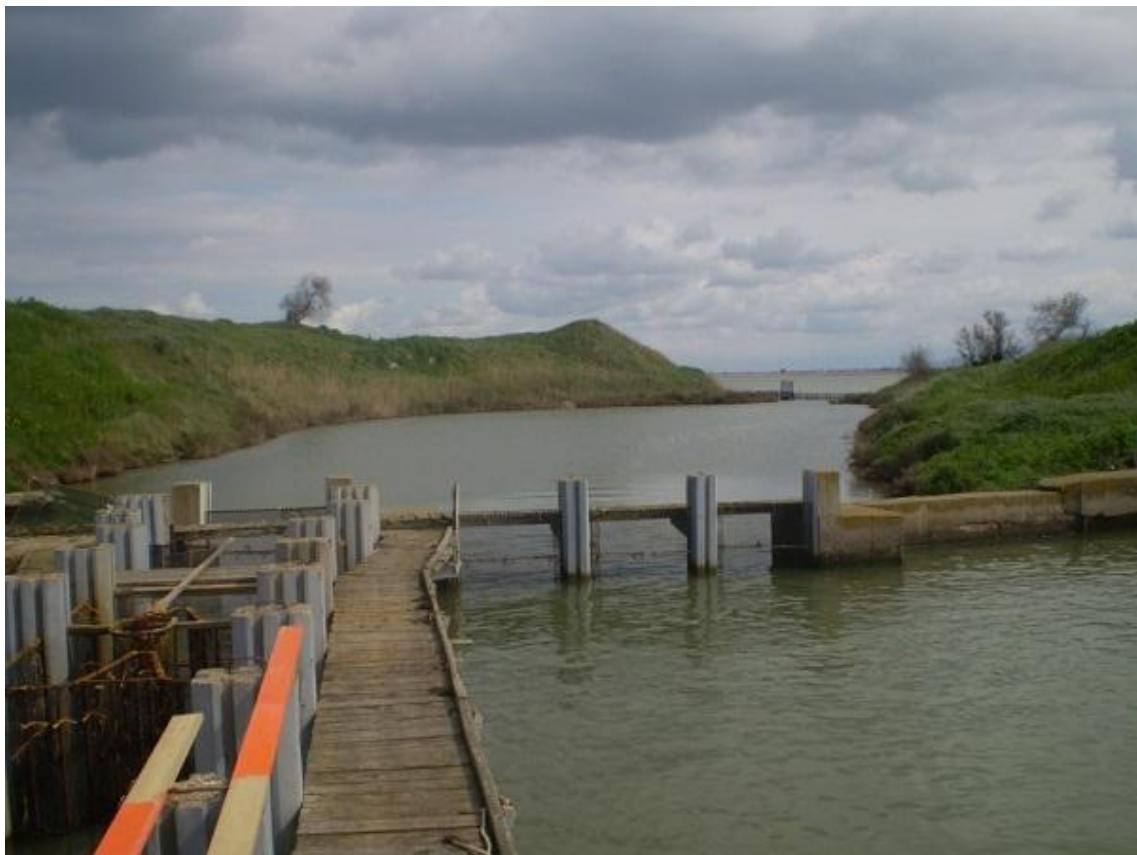
Η λιμνοθάλασσα Κοτυχίου

Ο Νομός της Ηλείας με συνολική έκταση 2.621 km 2 , έχει έδαφος πεδινό κατά 60% και διασχίζεται από τους ποταμούς Αλφειό, Πηνειό, Ερύμανθο και τους παραποτάμους τους. Ο Νομός χαρακτηρίζεται από την ύπαρξη παράλιων υδροβιότοπων (Κοτύχι, Καϊάφα) εξαιρετικού φυσικού κάλλους και οικολογικού πλούτου. Η πεδιάδα της Ηλείας είναι η μεγαλύτερη σε έκταση στην Πελοπόννησο.