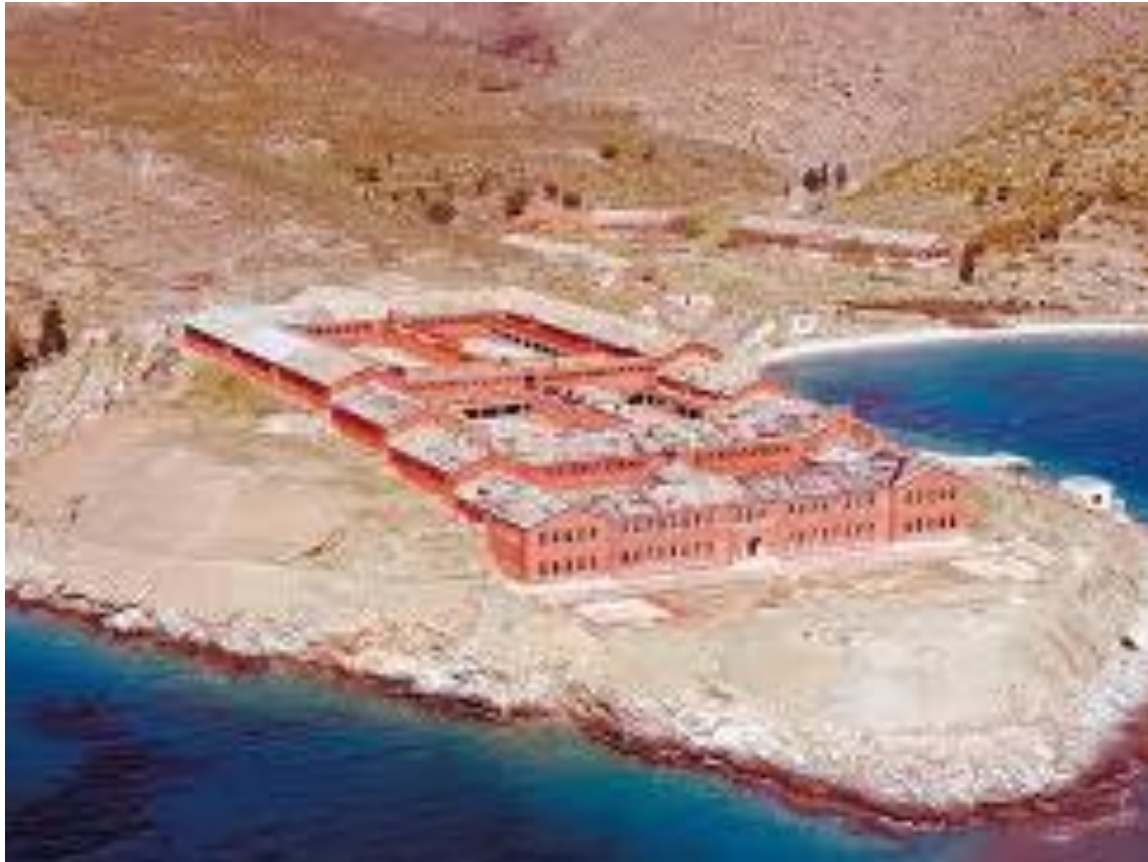
ΜΑΚΡΟΝΗΣΟΣ: ΤΟΠΟΣ ΕΞΟΡΙΑΣ, «ΑΝΑΜΟΡΦΩΣΗΣ» ΚΑΙ ΒΑΣΑΝΙΣΜΟΥ ΑΡΙΣΤΕΡΩΝ