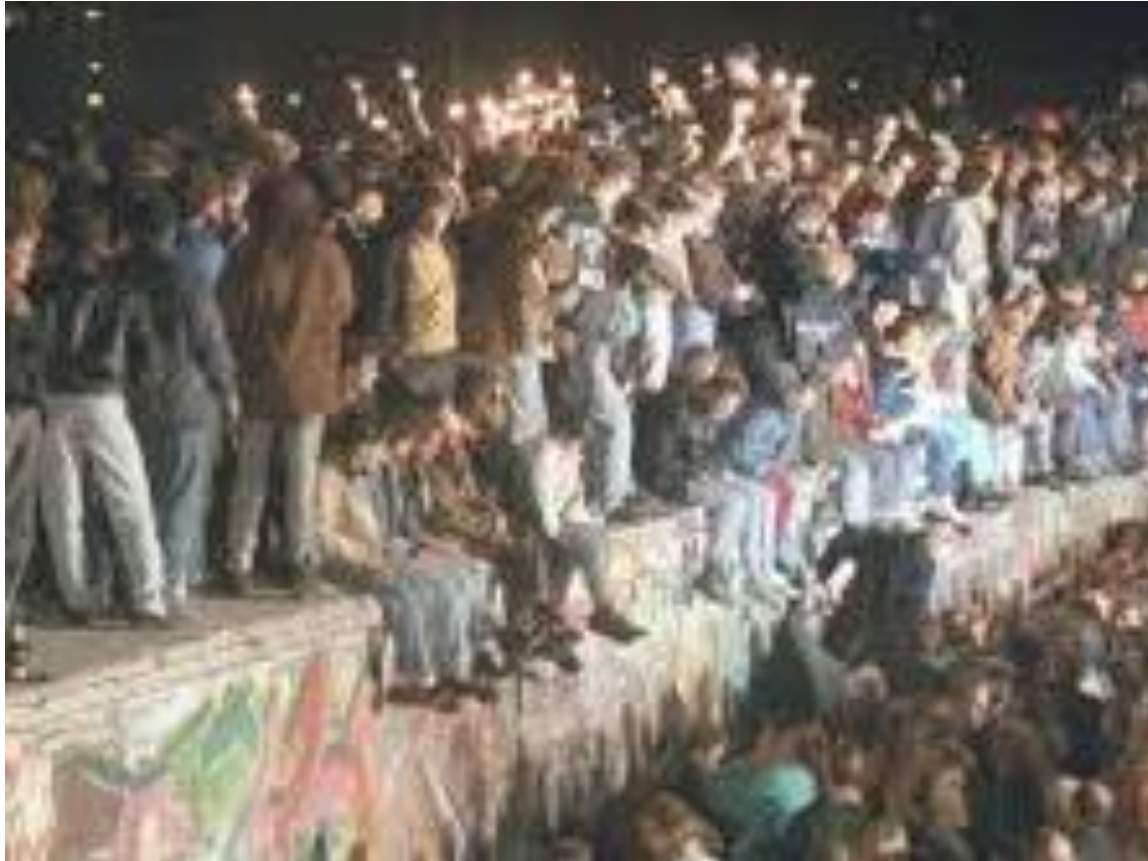
Εικόνες από την πτώση του τείχους του Βερολίνου