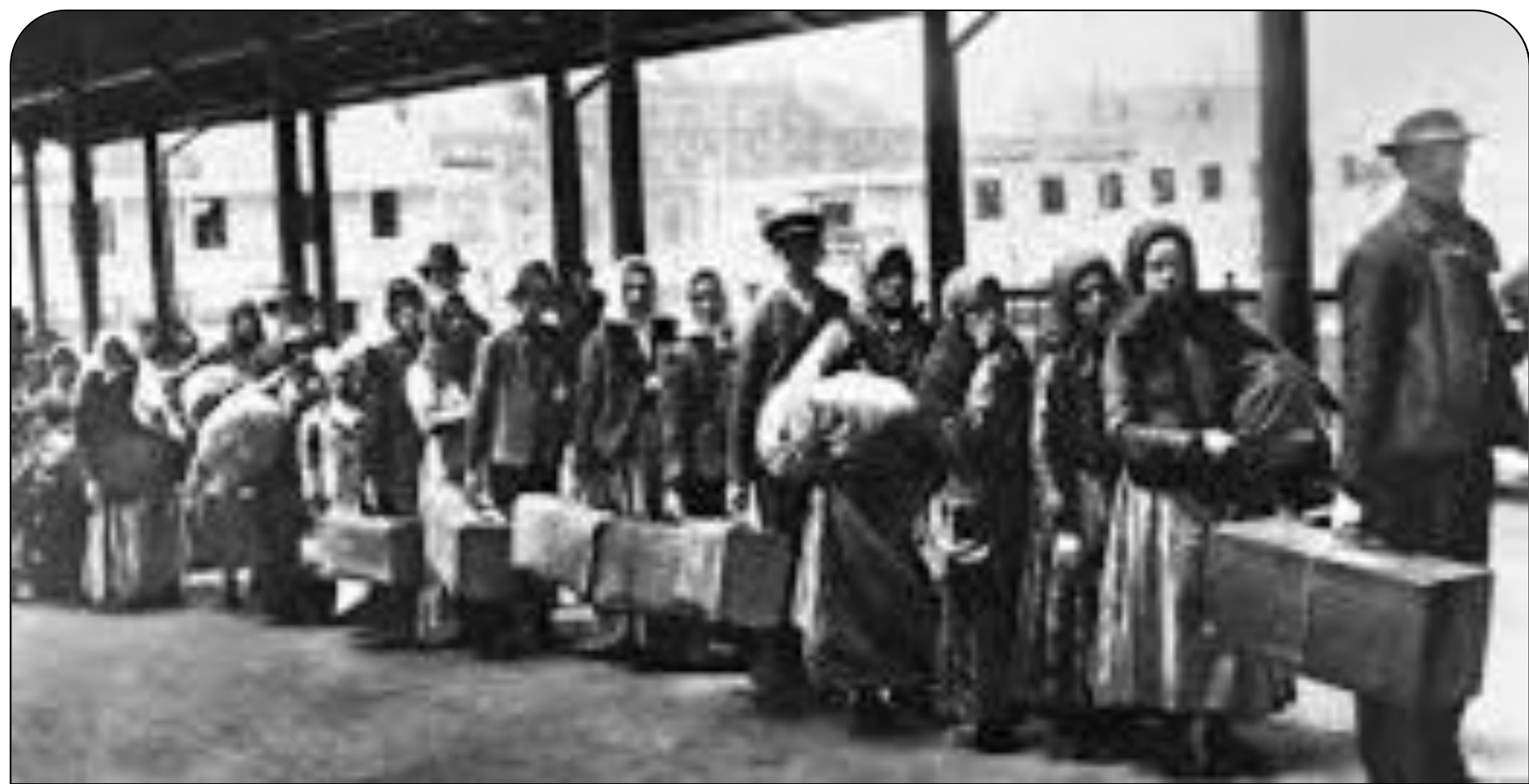
Έλληνες μετανάστες στην ουρά για εξέταση στο ELIS ISLAND